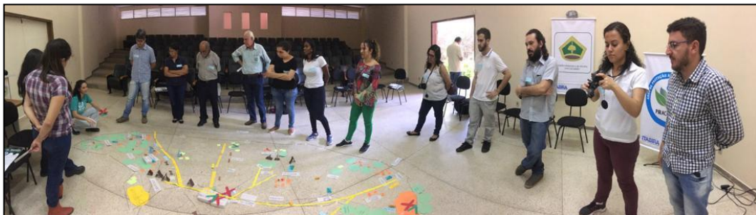
Figura 24 - Construção Mapa Falado - OPP 05