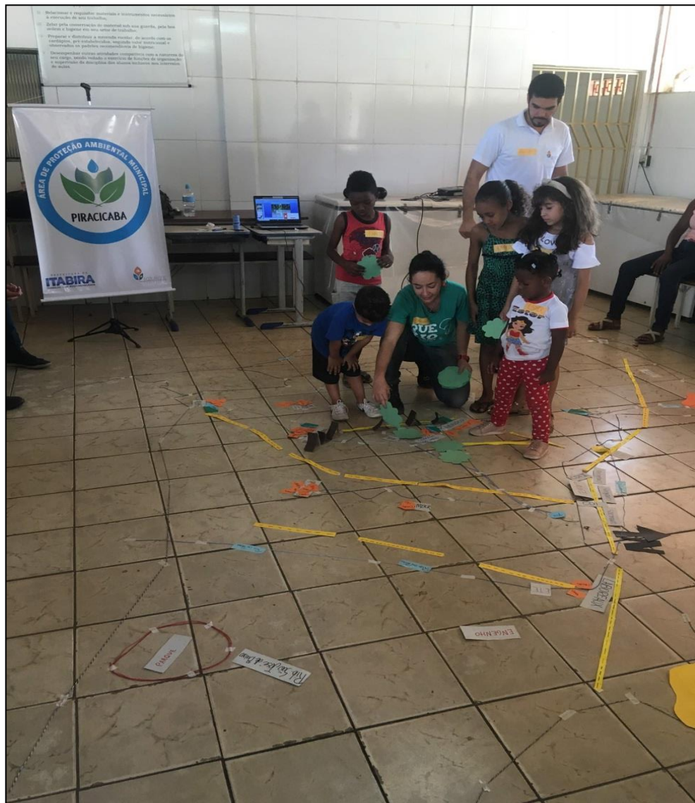
Figura 18 - Construção Mapa Falado - OPP 04