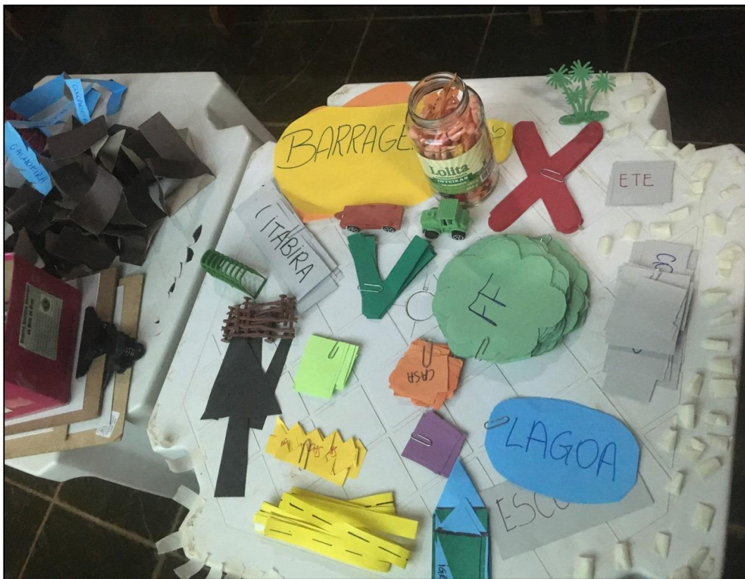
Figura 7 - Mapa Falado - OPP 02