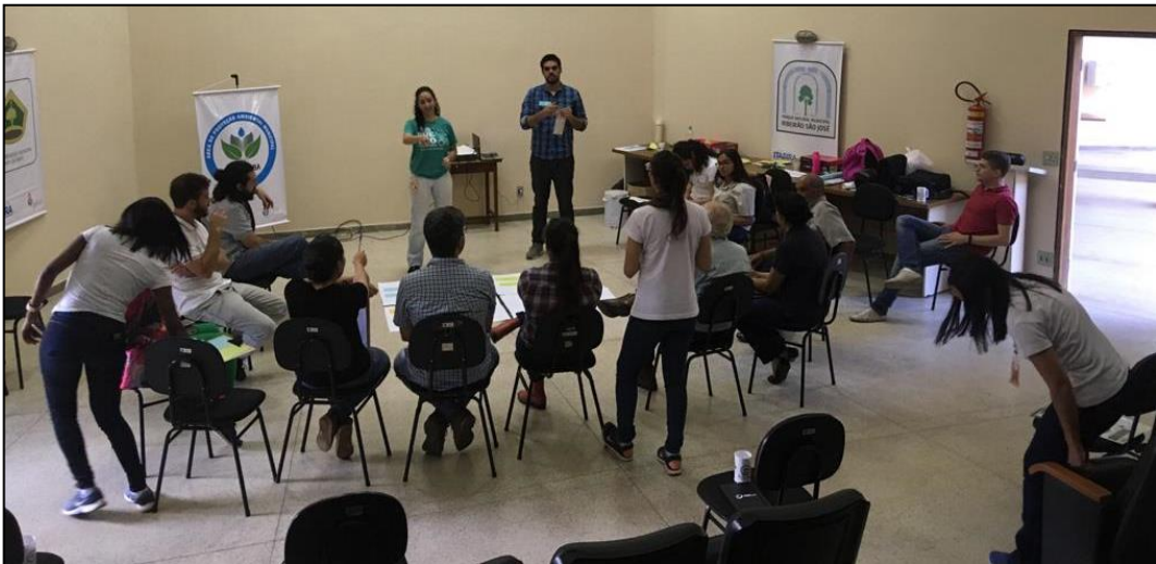
Figura 27 - Árvore dos Sonhos - OPP 05