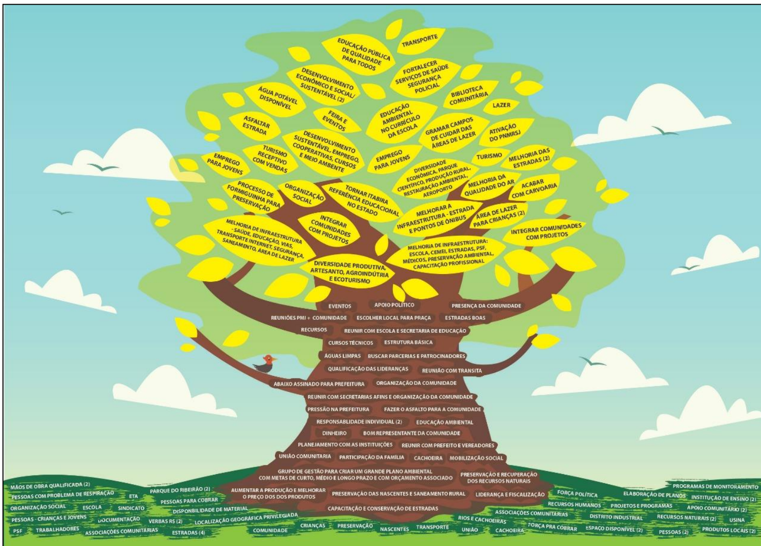
Figura 13 - Árvore dos Sonhos APAM Piracicaba