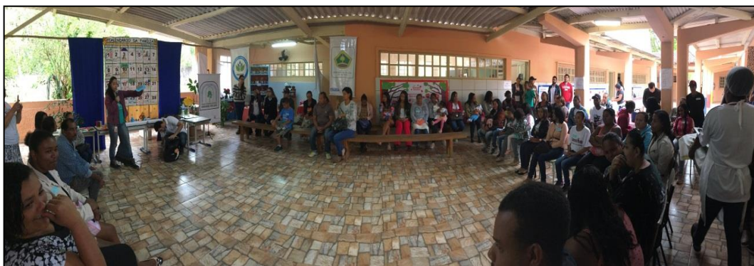
Figura 6 - Composição e organização dos participantes - OPP 02