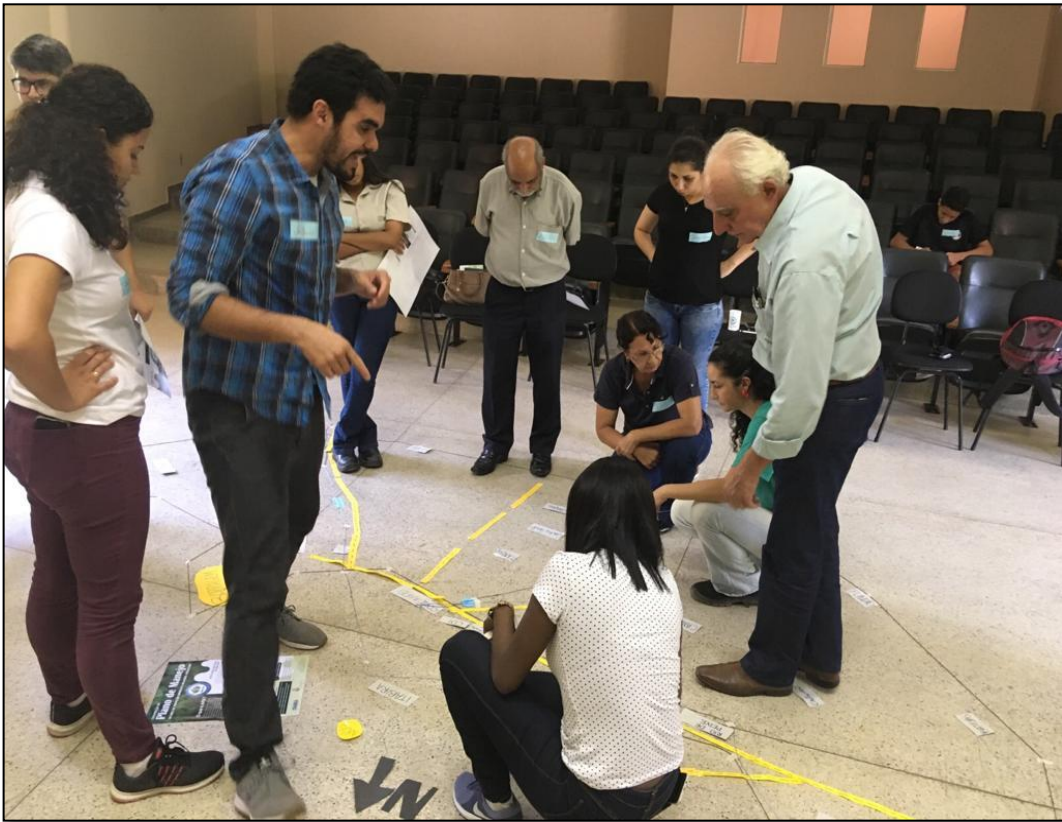
Figura 23 - Construção Mapa Falado - OPP 05