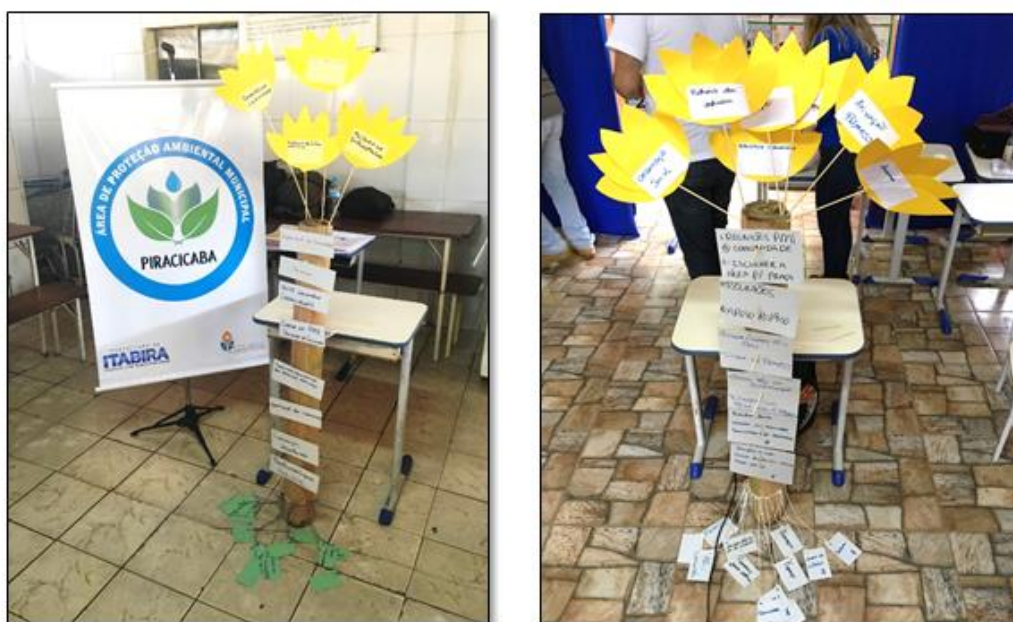
Figura 12 - Árvore dos Sonhos - OPP 02 e 04

Para finalizar as dinâmicas participativas propostas, foi construída a Árvore dos Sonhos, conforme Figura 12 e Figura 13, com os representantes das comunidades. A proposição e diálogo entre as pessoas presentes na dinâmica propicia visualizar o território onde os moradores e as pessoas envolvidas na região pensam em construir para sua comunidade.