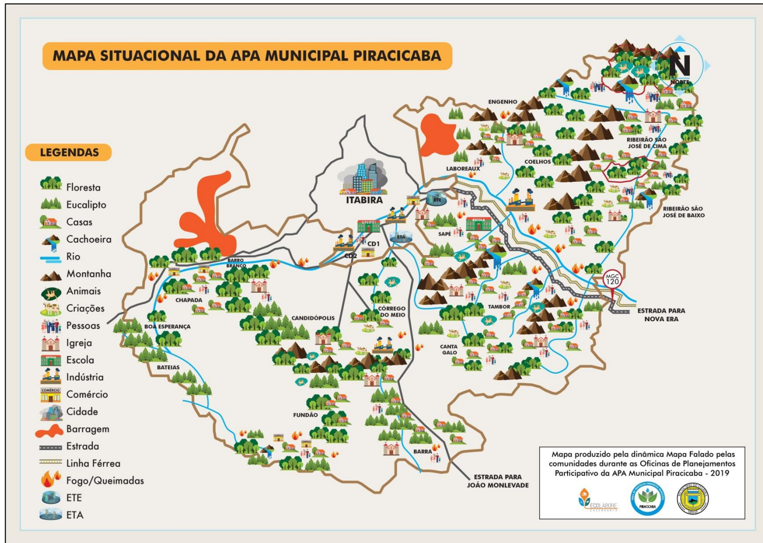
Figura 5 - Mapa Situacional da APA Municipal Piracicaba