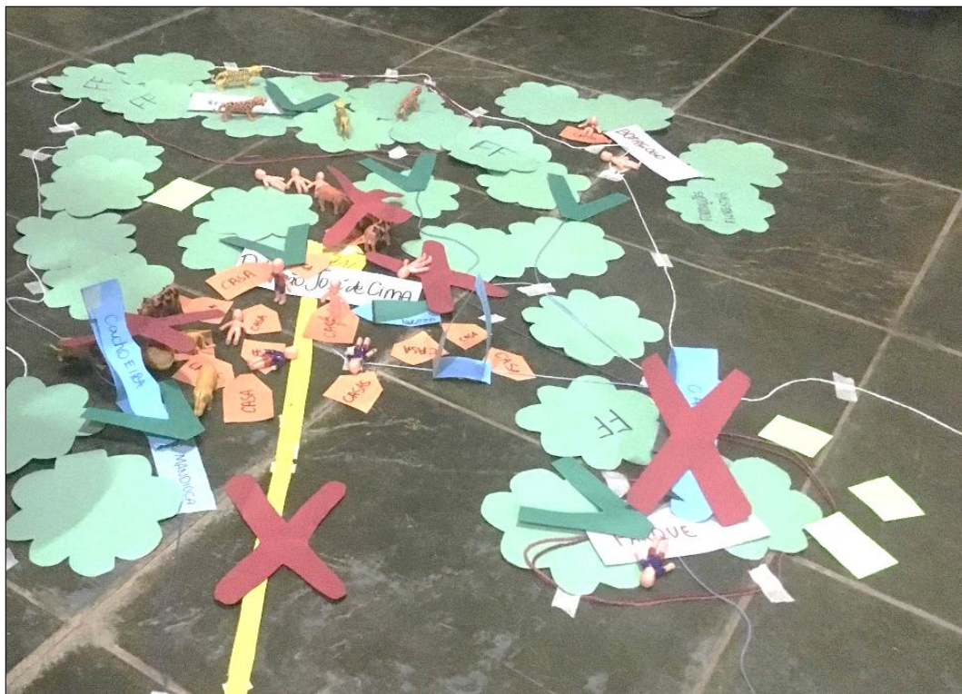
Figura 8 - Mapa Falado OPP 03 - Ribeirão São José de Cima

que a área representada pela comunidade, Figura 8, ficou restrita ao entorno do Parque Natural Municipal Ribeirão São José e a Reserva Biológica Mata do Bispo, ambas localizadas no interior da APA Municipal Piracicaba.