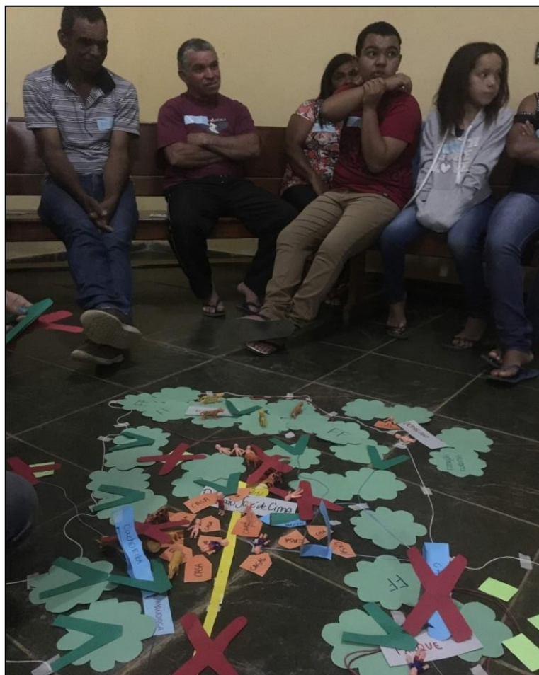
Figura 14 - Construção Mapa Falado - OPP 03