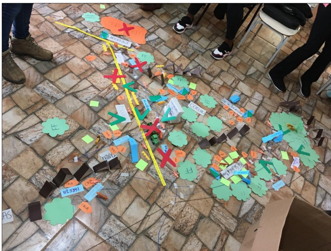
Figura 7 - Mapa Falado OPP 02 - Sapé

Destaca-se que no decorrer do Mapa Falado os facilitadores indagaram o público sobre o tempo que se encontrava domiciliado na região, no qual a maioria manifestou presença no território há mais de 20 anos. Sabe-se que o conhecimento no território é peça fundamental no desenvolvimento e no fortalecimento do sentimento de pertencimento e envolvimento dos moradores em ações relacionadas à projetos e programas socioambientais. Abaixo, na Figura 7, ilustra-se o Mapa Falado desenvolvido junto aos participantes na referida OPP.