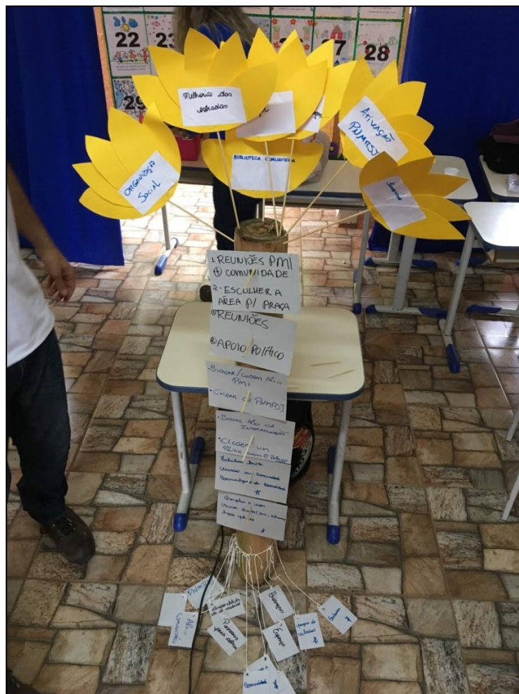
Figura 10 - Árvore dos Sonhos - OPP 02