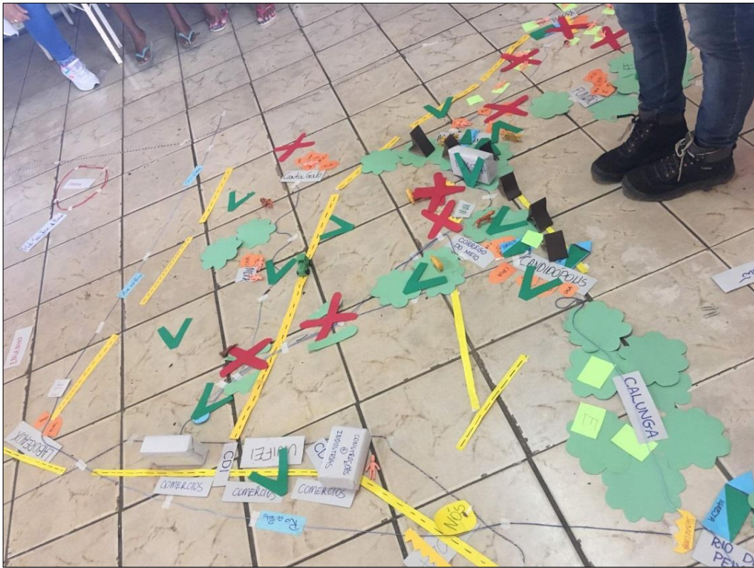
Figura 9 - Mapa Falado OPP 04 - Barreiro