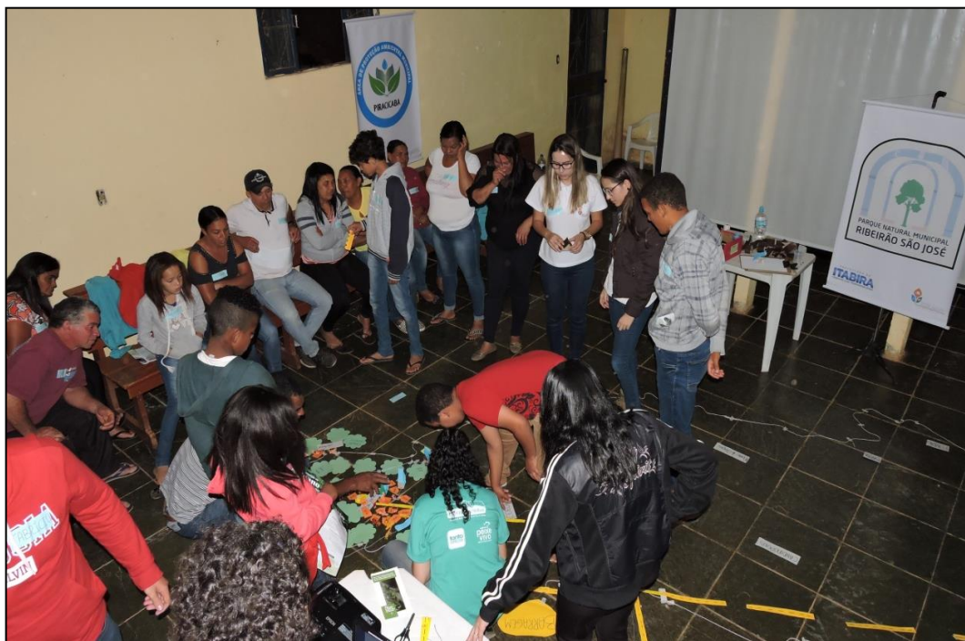
Figura 13 - Construção Mapa Falado - OPP 03