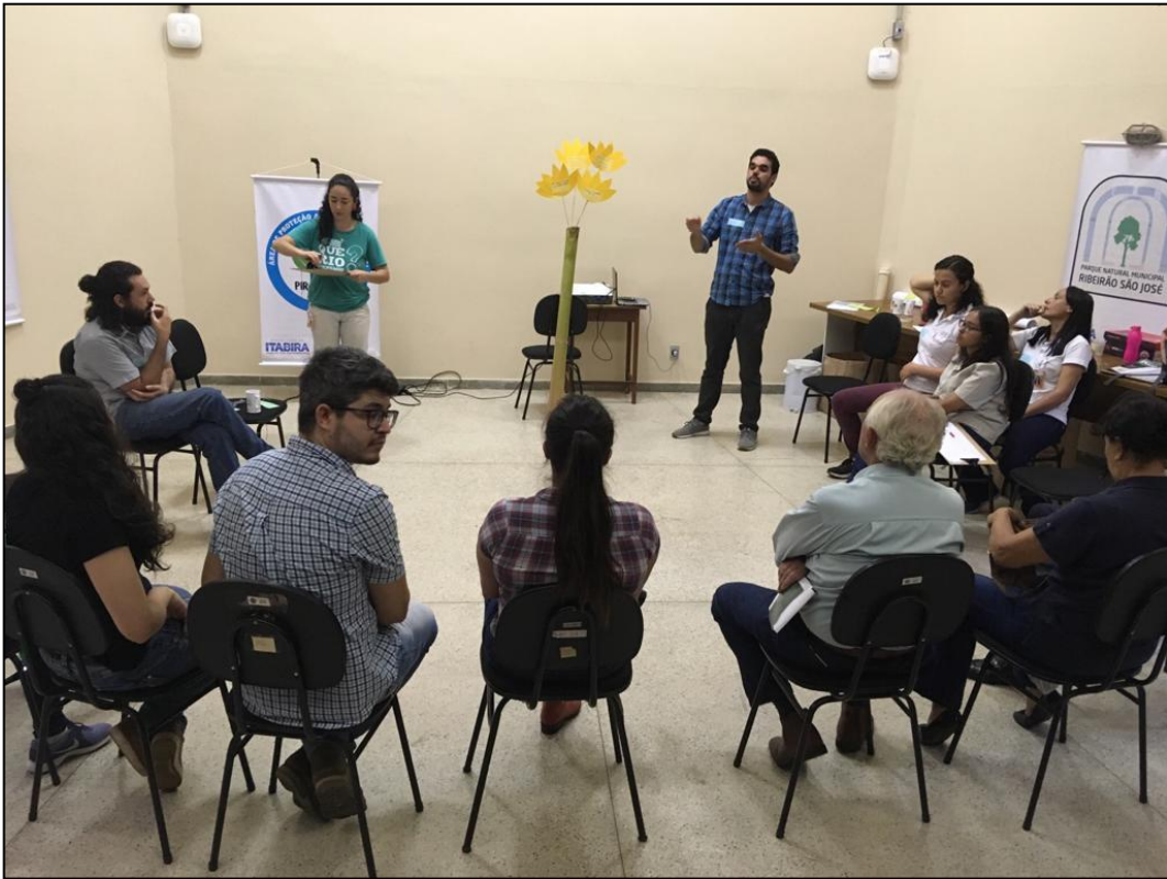
Figura 26 - Árvore dos Sonhos - OPP 05