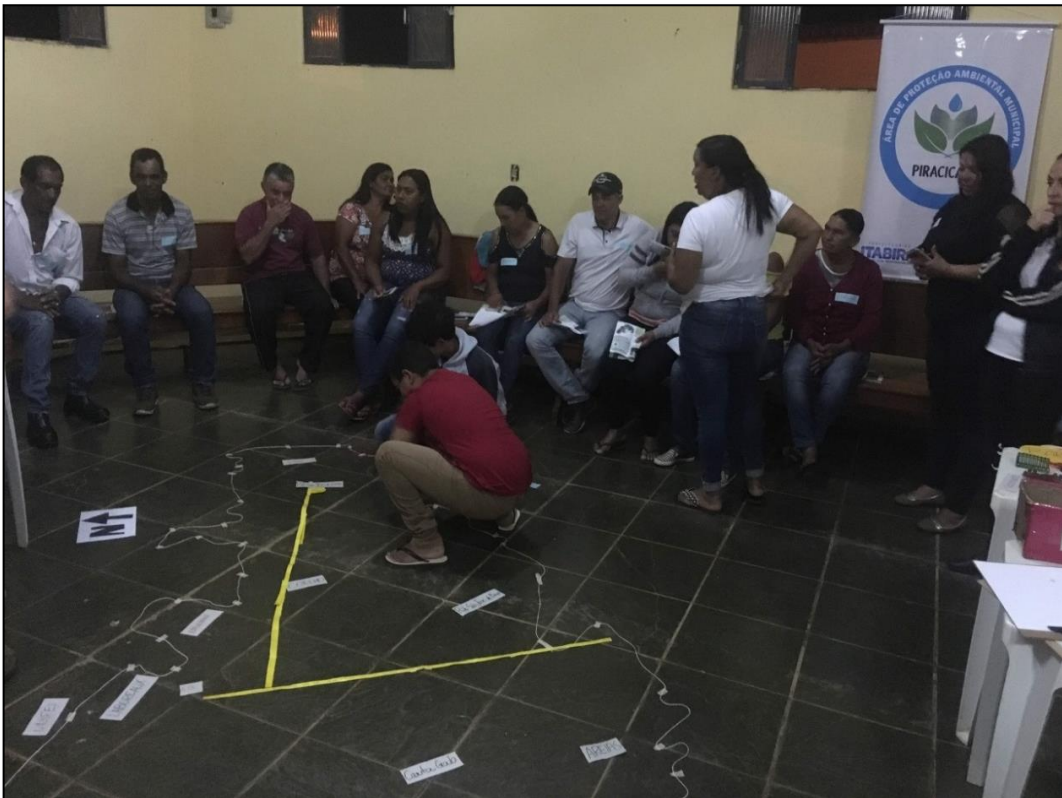
Figura 12 - Construção Mapa Falado - OPP 03