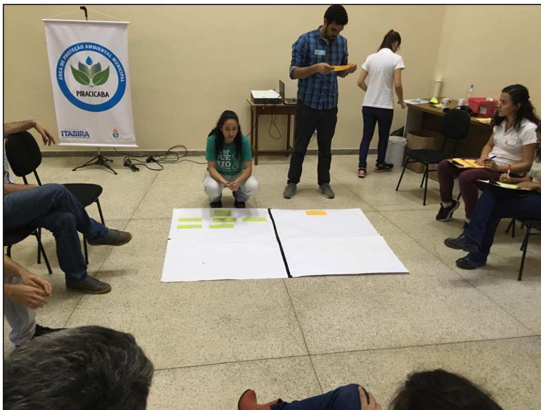
Figura 25 - Matriz FOFA - OPP 05