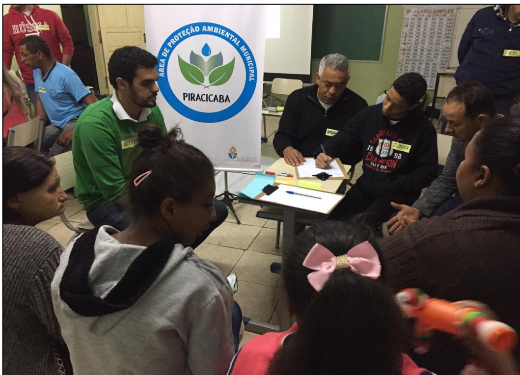
Figura 3 - Discussão de grupos para construção da MATRIZ FOFA - OPP 01