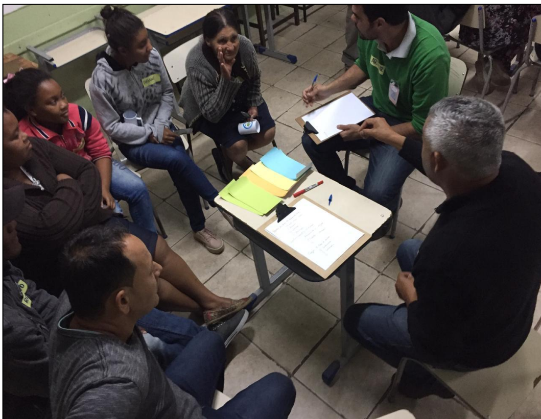
Figura 2 - Discussão de grupos para construção da MATRIZ FOFA - OPP 01