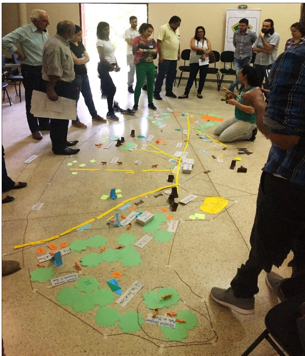
Figura 10 - Mapa Falado OPP 05 - Institucional