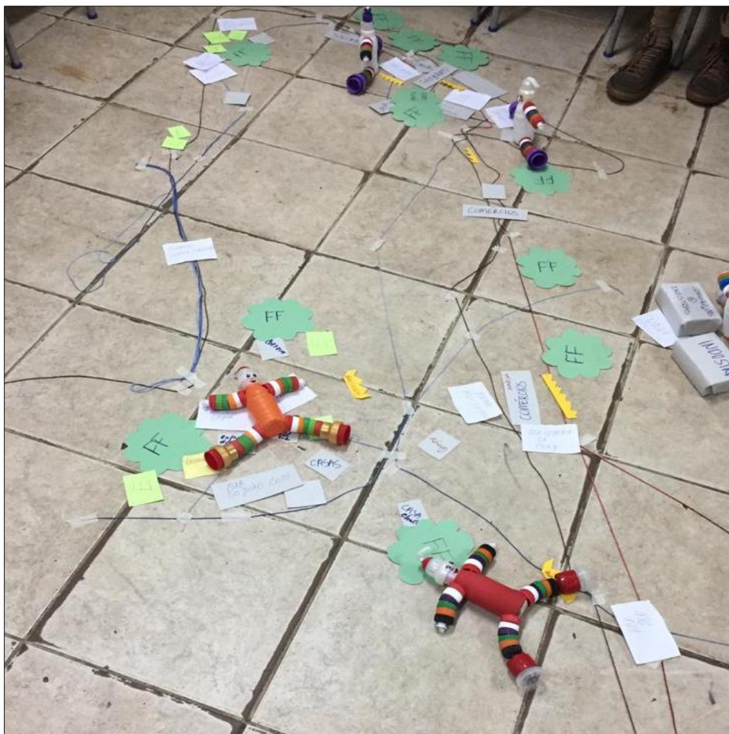
Figura 6 - Mapa Falado OPP 01- Chapada/Boa Esperança

Outro dado relevante foi a forma de inserir os elementos com muita regionalização, o que demonstra baixo conhecimento integrado da região. As informações expressas na dinâmica Mapa Falado, realizada na região da Chapada/Boa Esperança, está representado pela Figura 6.