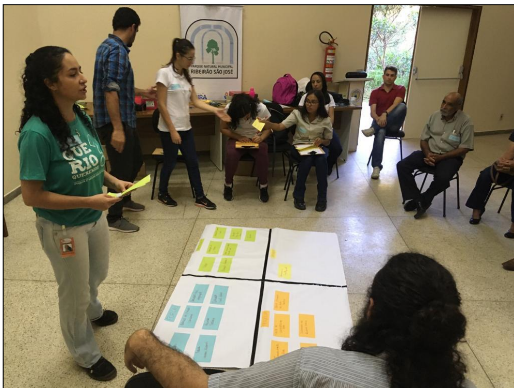
Figura 26 - Matriz FOFA - OPP 05