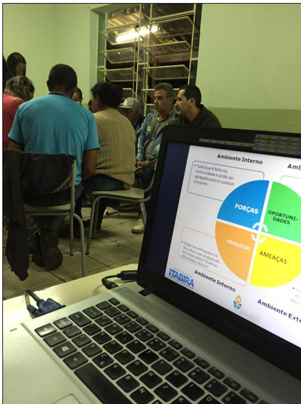
Figura 1 - Matriz FOFA - OPP 01