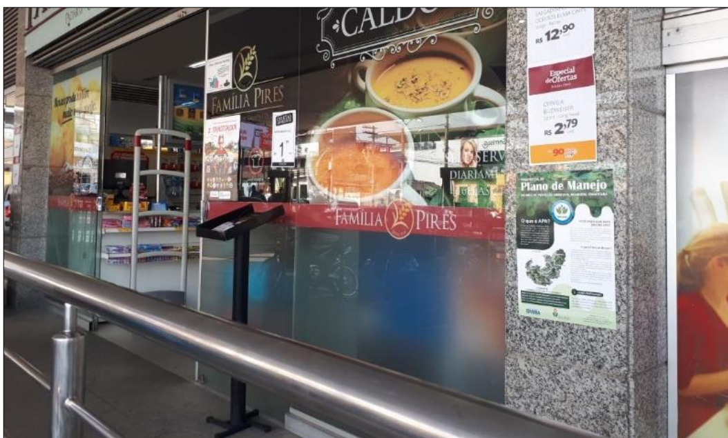
Figura 4 - Cartaz de Divulgação das OPPs fixado em estabelecimento comercial